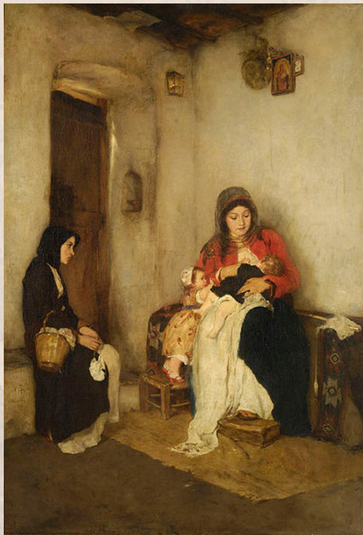
Η ψυχομάννα (N. Γύζης)

Λαογραφικό Μουσείο Μεγάλου Χωριού | Ώρα: 11.00